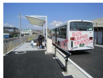
『日立商業下』停留所の風景

旧鉄道より停留所の数を増やし、近くで乗り降りができるようになったこと、朝早く、通勤通学する方にも、また、夜も遅くまで残業する方、お酒を飲んで帰ってくる方にも乗りやすいダイヤになっていることが特徴です。