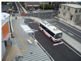
『南部図書館』停留所

旧鉄道より停留所の数を増やし、近くで乗り降りができるようになったこと、朝早く、通勤通学する方にも、また、夜も遅くまで残業する方、お酒を飲んで帰ってくる方にも乗りやすいダイヤになっていることが特徴です。