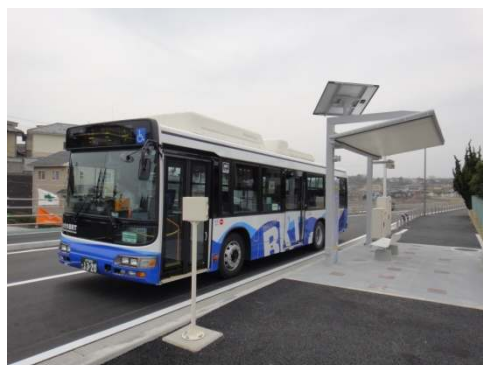
停車中の『ブルーラピッド』

さらに、日立の象徴でもある『海』と『桜』をモチーフとした可愛らしいデザインの車両だから、とっても楽しい気分になれます。おまけに『海』をデザインした『ブルーラピッド』はハイブリッドバスだから、環境にとっても優しい乗り物です。